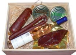
Präsentbox Zum Versenden geeignet mit Holzdeckel

Der Preis der Präsentbox richtet sich nach dem Inhalt, Sie selbst bestimmen können.