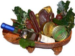
Präsentkorb Großes Widschwein 59,95 €

Verschenken Sie "wilde Spezialitäten" aus dem Taunus !!!