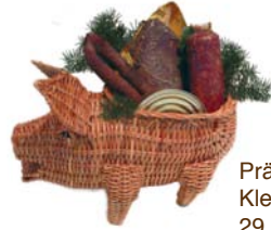
Präsentkorb Kleines Widschwein 29,95 €